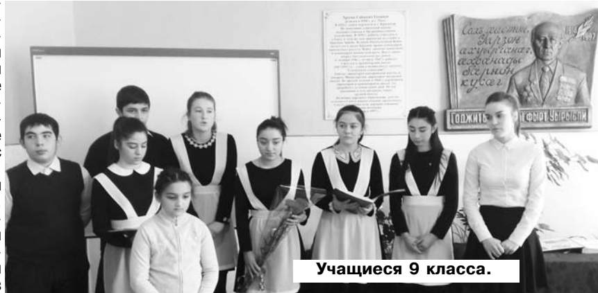
Учащиеся 9 класса.